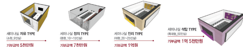
SK 미래관 기부 ROOM TYPE